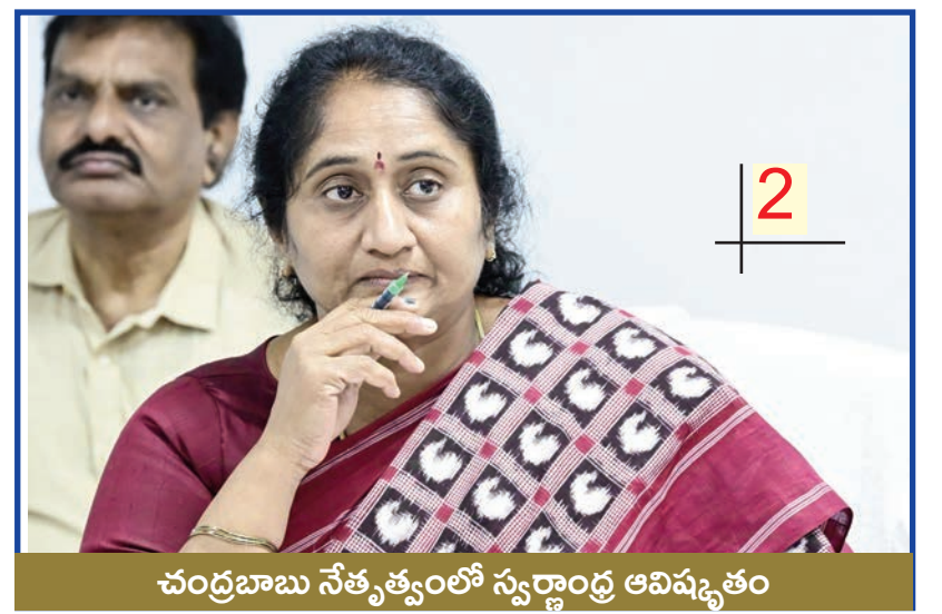
చంద్రబాబు నేతృత్వంలో స్వర్ణాంధ్ర ఆవిష్కృతం