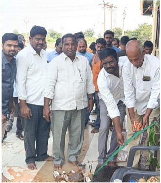
ప్రజా భూమి ప్రతినిధి, చిన్న శంకరంపేట: