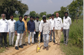
ప్రజా భూమి ప్రతినిధి, చిన్న శంకరంపేట, :

చిన్న శంకరంపేట మండలం మిర్జాపల్లి రైల్వే స్టేషన్ నుండి నార్కెండ్ల మండలం శివపల్లి వరకు కోటి రూపాయలతో బీటీ రోడ్డు నిర్మాణ పనులకు నిధులు మంజూరయ్యాయి.