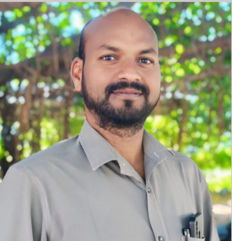
ప్రజా భూమి ప్రతినిధి, దొల్తాబాద్: