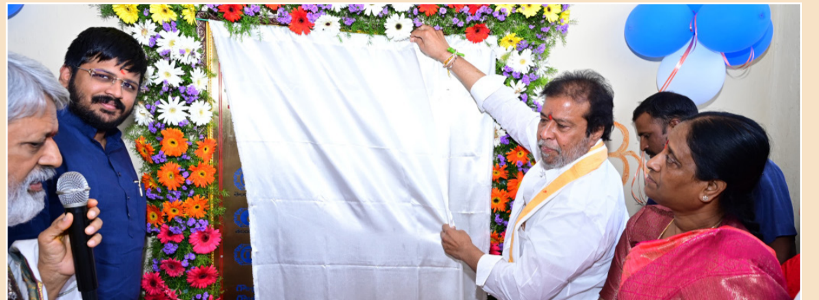
ప్రజాభూమి ప్రతినిధి, మెదక్: