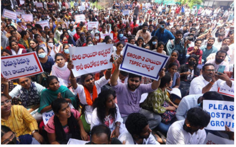
ప్రజాభూమి ప్రతినిధి, హైదరాబాద్ అశోక్ నగర్లో మళ్లీ ఉద్రిక్త వాతావరణం ఏర్పడింది. గ్రూప్ 1 పరీక్షలను రీ షెడ్యూల్ చేయాలని పరీక్ష వాయిదా వేయాలని కోరుతూ విద్యార్థులు చేస్తున్న ఉద్యమం తీవ్ర రూపం దాల్చుతోంది. పరీక్ష వాయిదా కోసం మూడో రోజు శుక్రవారం ఆందోళనకు దిగిన

గ్రూప్ 1 అభ్యర్థుల ఆందోళన ఉద్రిక్తం రోడ్లపైకి వచ్చి ప్లకార్డులను ప్రదర్శన జీవ్ 29 రద్దు.. పరీక్షలు వాయిదా వేయాలని డిమాండ్ ఉరికించి కొట్టిన పోలీసులు.. పలువురికి గాయాలు రీ షెడ్యూలింగ్ కోరుతూ దాఖలైన అప్పీల్ పిటిషన్ హైకోర్టు కొట్టివేత సింగిల్ బెంచ్ తీర్పును సమర్థించిన డివిజన్ బెంచ్ ఈ నెల 21 నుంచి యాథావిధిగా మెయిన్స్ ఎగ్జామ్స్ అటు సుప్రీంను ఆశ్రయించిన అభ్యర్థులు విచారణ సోమవారానికి వాయిదా