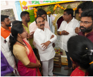
ప్రజాభూమి, తెలంగాణ బ్యూరో :