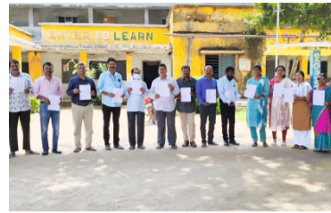
నార్సింగి, అక్టోబర్ 15 (ప్రజాభూమి):