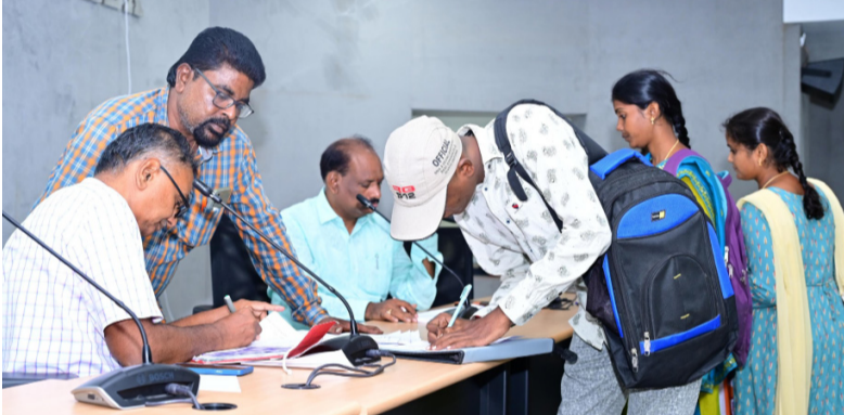
మెదక్, అక్టోబర్ 15 (ప్రజాభూమి):