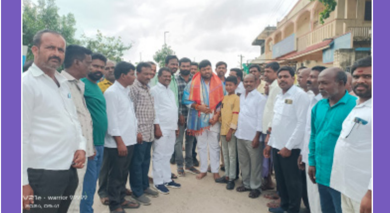
నార్సింగి, అక్టోబర్ 15 (ప్రజాభూమి):